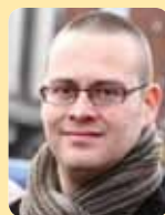
Raoul Hedebouw Porte-parole du PTB+ Tête de liste – Chambre – Liège

Bon à savoir : lisez plus sur notre engagement, notre programme et nos candidats sur www.ptb.be